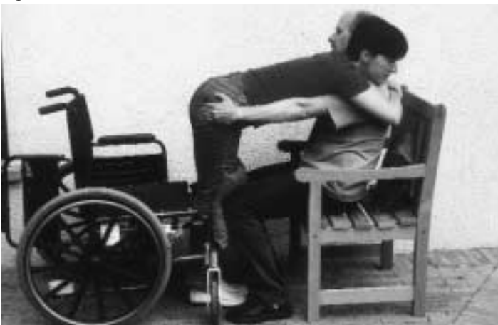
Fig 4 en 5

Door een schommelbeweging brengt de hulpverlener zijn gewicht naar achter en gaat neerzitten op de stoel die achter hem staat. Hierbij zorgt hij ervoor dat de knieën van de PMH goed naar achter worden gedrukt (fig. 4 en 5). Op die manier dragen de benen het gewicht van de PMH en rust het bovenlichaam op de schouder van de hulpverlener. Doordat de hulpverlener neerzit kan hij het gewicht van de PMH een lange tijd dragen. Door de handen wat lager te plaatsen is het mogelijk dat een derde persoon de broek naar beneden doet en de nodige zorgen uitvoert of het kussen vervangt (voor dit laatste mag je de broek gerust aanlaten). Door zijn gewicht naar voor te plaatsen kan de PMH terug in zithouding worden gebracht.